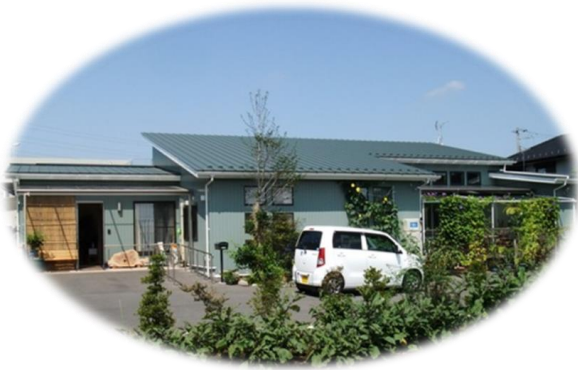
デイホーム さわやか学舎